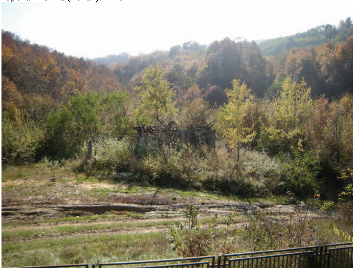
Слика 40. Локалитет Црквине у Драгиној мали, у месту Коцељева. 178

Географске координате локалитета „Црквине у Драгиној мали“ у месту Коцељева су: Северна географска ширина (латитуда): \varphi = 44^{\circ} 27' 47.21'' ; Источна географска дужина (лонгитуда): \lambda = 19^{\circ} 50' 02.04'' ; Надморска висина (левел): l = 161 м.